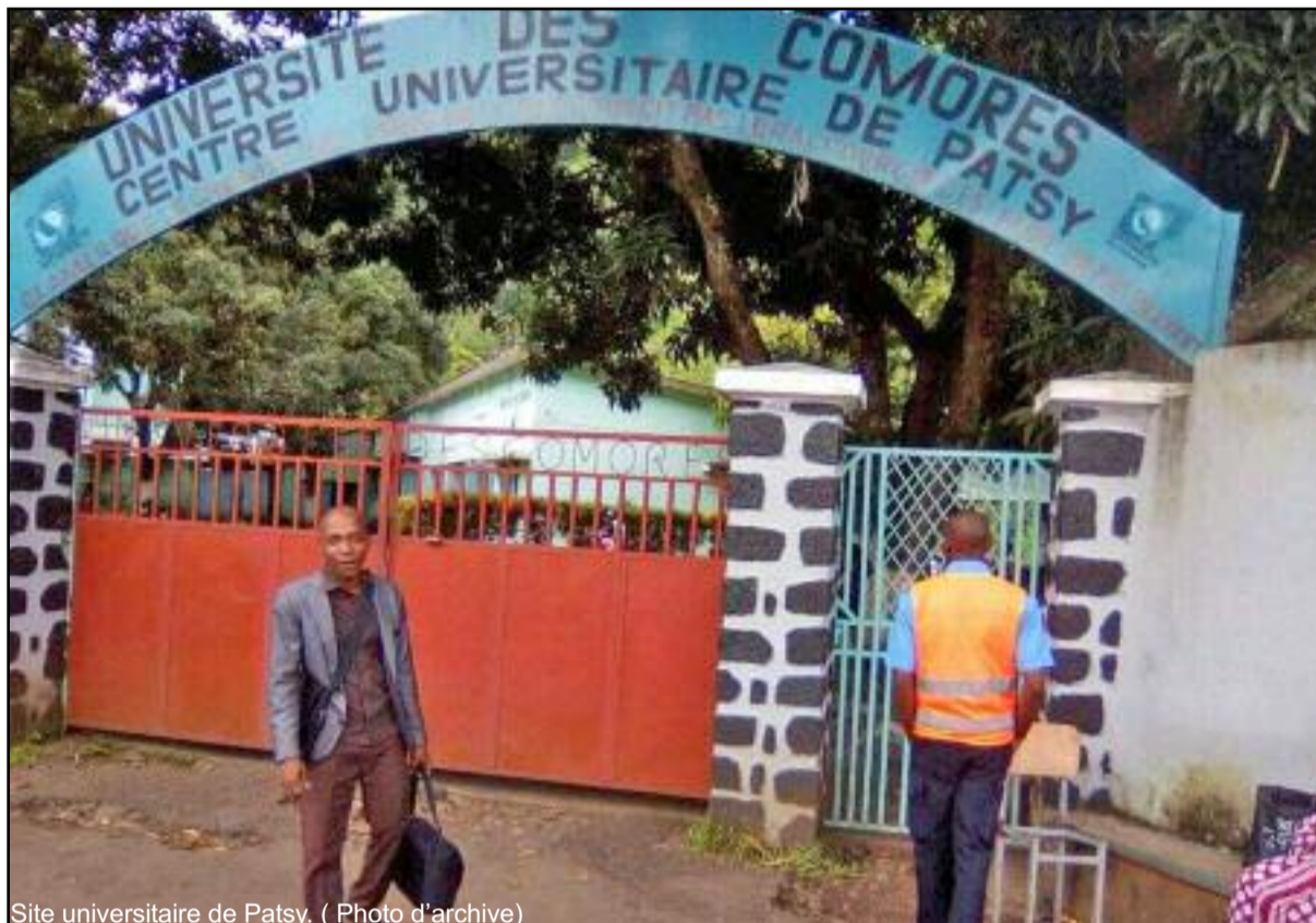
Site universitaire de Patsy.

Le collectif des docteurs enseignants contractuels du centre universitaire de Patsy à Anjouan menace d'entamer une grève de 48 heures suivie d'une descente dans la rue après le 30 avril prochain. Dans un combat entamé depuis plus de 2 ans pour réclamer un statut qui se fait toujours attendre, ces contractuels sont dépourvus de salaire pendant les vacances, ne cotisent pas à la caisse de retraite malgré leur âge. Ils sont moins considérés que les gardiens et femmes de ménage, ils n'ont pas le droit de prendre des responsabilités ni de bénéficier d'aucun autre avantage parce qu'ils n'ont que des contrats de