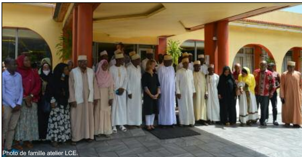
Photo de famille atelier LCE.

divers secteurs, s'étaient divisés en quatre groupes et ont travaillé sur les thématiques proposées. Lors des restitutions, les différents groupes ont fait des propositions en vue d'améliorer les textes fournis par un consultant international. Il a été question d'harmoniser les différents éléments proposés sur la base du contexte national qui est relativement différent du niveau continental.